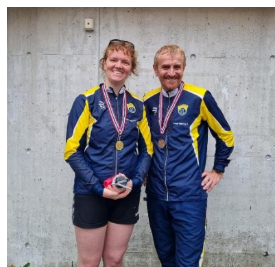
Bilete 3: Medaljevinnarar i KM-sprint