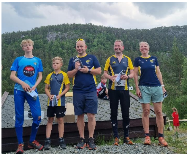
Bilete 2: Samnanger 1 i Kompisstafetten